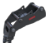
Adapter voor vrijhangende uitrustingsstukken