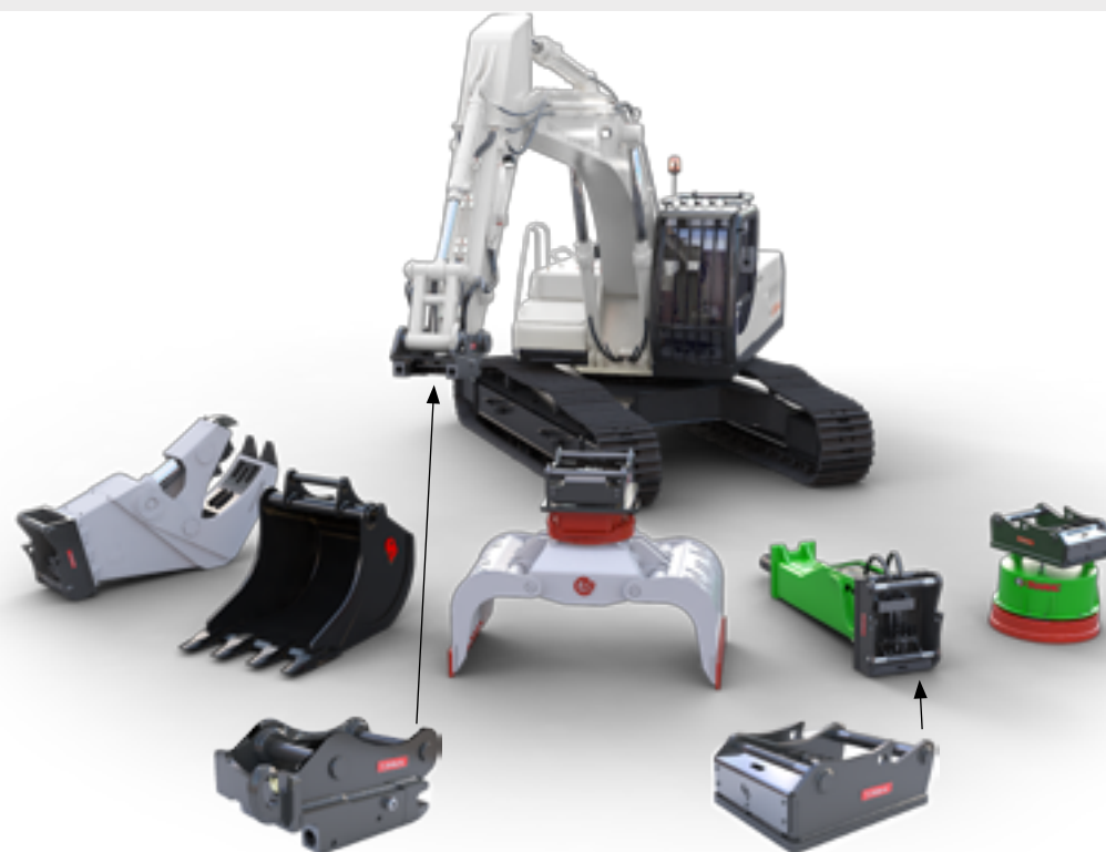
Snelwisselsysteem met hydraulische en elektrische koppelingen